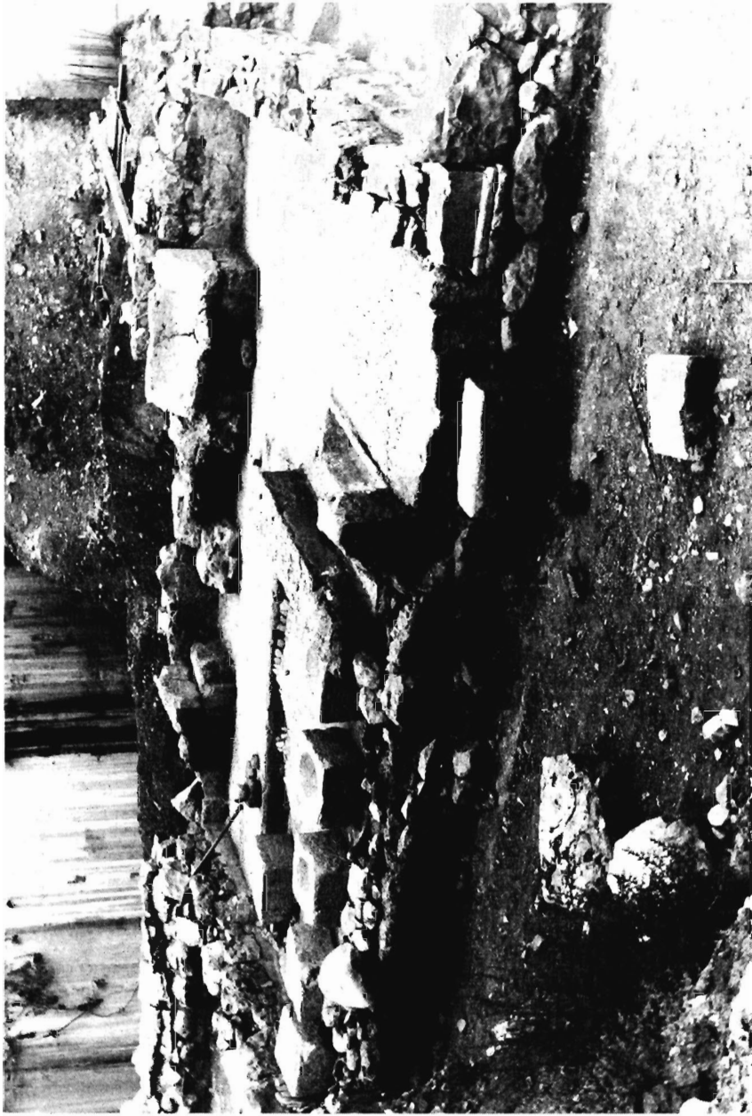
Ἡ ἀρχαία παλαιότερα τῆς Λαμίας: Ἐμπρὸς ἢ εἰσοδος. Στὸ βάθος τῆς ὑπερνωφωμένος ἕνας λουτήρας. Ἄριστερὰ τῆς εἰσοδου οἱ πέτρινες κούπες. Στὸ βάθος ἀριστερὰ φαίνεται ἓνα τμήμα ἐπιχρισμένου τοίχου. Δεξιὰ τοῦ λουτήρα μιὰ λεκάνη δαπέδου.