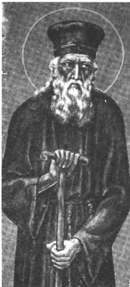
Πατροκοσμᾶς ὁ Αἰτωλὸς (1714-1779)