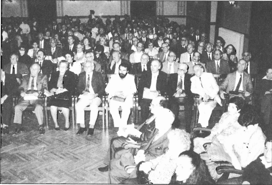
Άποψη της κατάμεστης από ακροατές Μεγάλης Αίθουσας Διαλέξεων του Φιλολογικού Συλλόγου «Παρνασσός» το βράδυ της 16ης Ὀκτωβρίου, κατά την διάρκεια της εκδήλωσης του «Λαυλού» για τὸ Ἑλλάβητο.